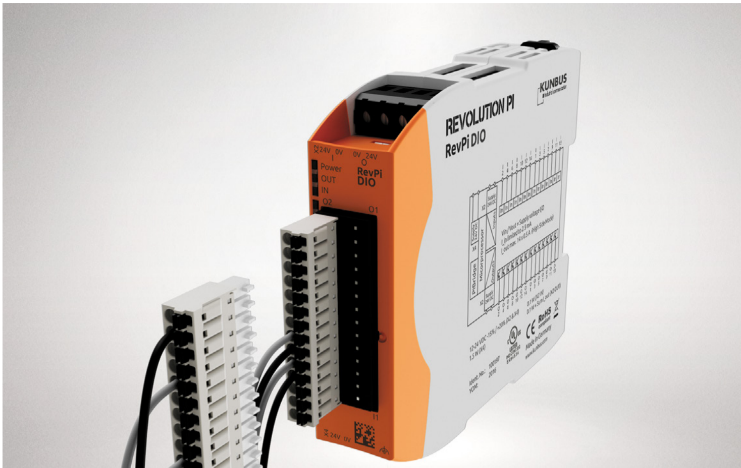
Digitales I/O-Modul RevPi DIO mit 14 digitalen Ein- und Ausgängen.