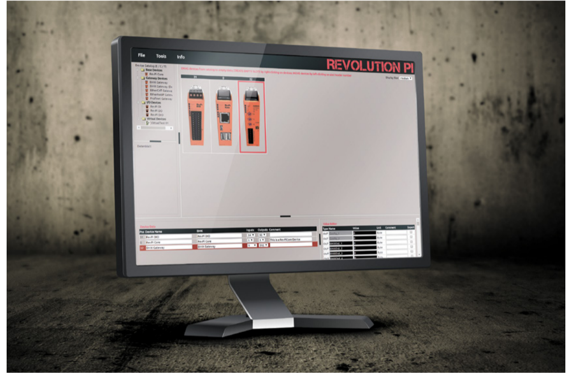
Mit der grafischen Konfigurations-Software PiCtory, lässt sich das Revolution Pi System einfach konfigurieren.

Die fertige Konfigurationsdatei wird als JSON-Datei abgespeichert und auf das Revolution Pi System übertragen.