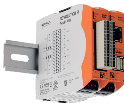
RevPi Core 3 und RevPi AIO auf der Hutschiene.

Wie die digitalen I/O-Module, ist auch das RevPi AIO für den harten Industrielltag bestens gerüstet und kann zwischen -40 and +50°C Umgebungstemperatur und bis zu 80% rel. Luftfeuchte betrieben werden. Zudem ist das Modul gegen statische Entladungen, Burst- und Surge-Impulse gemäß der Forderungen von EN61131-2 geschützt.