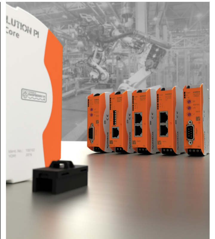
Verfügbar für alle gängigen industriellen Netzwerkprotokolle, helfen die RevPi Gates dabei, Revolution Pi in ein industrielles Netzwerk zu integrieren.

Zusätzlich können die Ausgänge so konfiguriert werden, dass bei High-Side Ausgangstyp auch eine „Open-Load“-Erkennung (Leitungsbruch) eingeschaltet und ein entsprechender Alarm an das Revolution Pi Basismodul übermittelt wird. Genau wie die Eingänge, sind auch die Ausgänge gegen statische Entladungen, Burst- und Surge-Impulse gemäß der Forderungen von EN61131-2 geschützt.