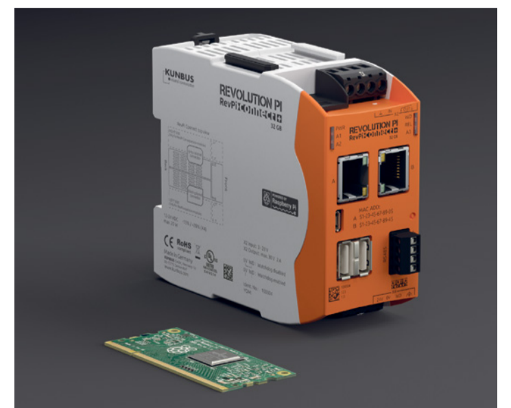
Mit 45mm ist der RevPi Connect doppelt so breit wie der RevPi Core 3.

Der RevPi Connect besitzt zudem eine 4-polige RS485 Schnittstelle an der Front, um beispielsweise direkt Modbus-Sensoren ohne Adapter anzuschließen.